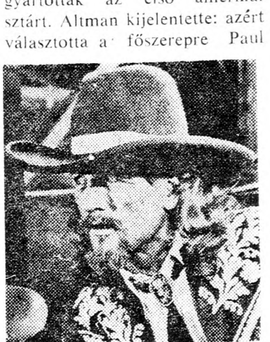
PAUL NEWMAN Buffalo Bill szerepében „Előregyártott elemekből készült bálvány”

A háttér: kéklő hegyek, mély szakadékok, vad vizesés. Két ut törő elkészítet harcot folytat a kegyetlen indiánokkal. Láthatóan nincs semmi esélyük a megmenekülésre. A hosszú évek során alaposan idomított néző a felmentő csapatok érkezését várja. Egy mély férfihang a kíséreszöveget olvassa: „Ilyen áldozatok árán született meg a nagy amerikai nemzet...” Ebben a pillanatban a rendező, Robert Altman hangja csendül fel: „Megállni, motort leállítani”. A jelenet egy cirkuszban játszódik le, nyomorúságos felelevenítése a western szuper-produkcióknak.