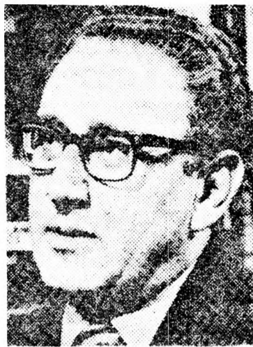
Nixon volt az egyetlen, aki fin forgott, amikor a Nobel-díjat Henry Kissingernek adták.

olyan egyezményre kényszerültek, amelyet négy évvel azelőtt is elérhettek volna. Abban az időben egyébként nem Richard