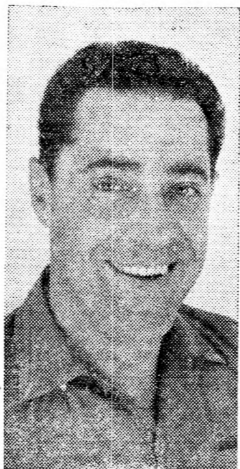
GRIFFEL Magából kivelve...

Griffel javaslatát a Dizengoff Center felépítése ügyében. Egy adott pillanatban Griffel el-