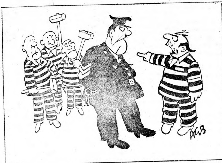
— Csak nem gondolja, hogy ezekkel a csirkefogókkal együtt dolgozom!