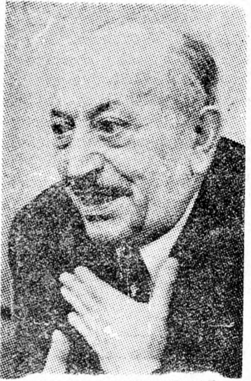
SIMON WIESENTHAL A náci bűnösök utáni kutatásról

arab együttműködésnek a célja „bebizonyítani” a nagyvilágnak, miszerint a náci nem hajtottak végre semmi bűntényt a zsidó nép ellen a második világháborúban... Erre a tevékenységre jellemző, hogy Londonban például kiadtak egy brosurát „Valóban elpusztult hatmillió?” címen. Ezt az antiszemita uszító pamfletet megküldték az angol parlament tagjainak és terjesztik az angol nyelvterületen.” Nyugat-Németországban és Ausztriában olyan róplapokat terjesztenek, amelyek egész egyszerűen