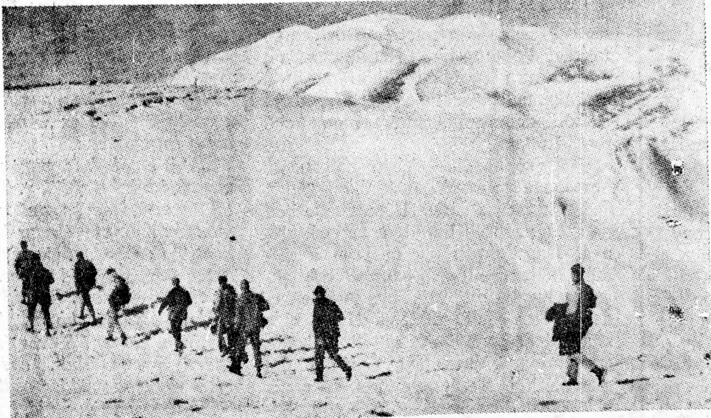
A HÓFEDTE CHERMON

millió fontot fektettek be. Az étel természetesen kóser és a kirját-szomoni rabbinátus felügyelete alatt áll. Az árak elfogadhatók: komplett étkezés, mint például egy adag sült csirke, körettel, zöldség salátával, olajbogyóval, levestel és egy pohár konyví itallal mindössze 30