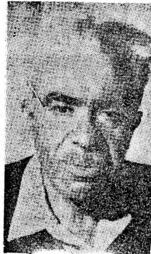
MÉIR JÁARI: „Együtt zuhanunk...”

nek a Munkapárt és a Mápám további választási szövetségét a Máárach keretében és a Mápám önállóan készülő fellépni a kilencedik Kneszet választásain. Ez kifejezésre jutott Mair Jáari, a párt főtitkárának formális javaslatában, miszerint a Mápám megkezdte a tényleges előkészületeket önálló parlamenti listával