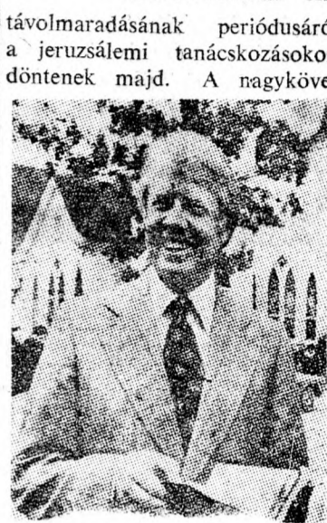
JIMMY CARTER: „Megrendültem”

Magyar ételkülönlegességek. Déliben és este nyitva Szolid árak. T.A., IBN GVIROL 3. Tel. 230-100 Pénteken zárva