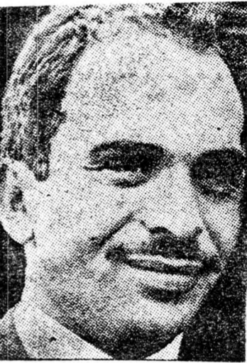
HUSZEIN: „Izrael most erősebb”

Egy héttel közelkeleti körúti előtt adott nyilatkozatában a főtitkár optimizmussal ítélte meg a körzetben folytatandó tárgyalásai kilátásait. „A fontos, hogy