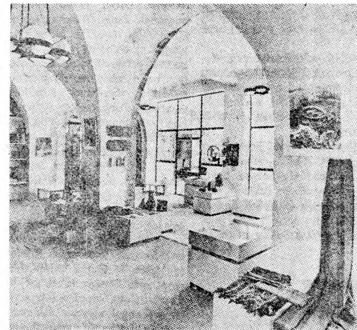
RÉSZLET A KIÁLLÍTÓTEREMBŐL

A kiállítóterembe a felvétel a következőképpen történik. A különböző iparművészek (kötészővés, üvegfűzés, ötvösség, kerámiakészítés, stb.) választott bizottság elé viszik a munkáikat, melyek közül a kiválóak megkapják az „ot hámuvcár hájerusálmí” kitiúntést (az épület neve is innen van). A bizottságban egy művész, egy belső építész, egy mérnök, és a kereskedelmi és ipari minisztérium egy-két képviselője foglal helyet. A kiállítóterem részére azo-