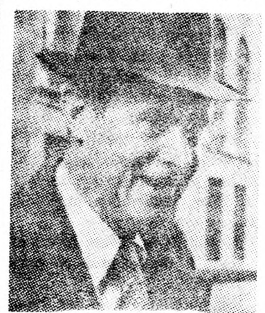
CYRUS VANCE A kérdést tanulmányozni kell

Az amerikai küldöttség tagjait legfontosabb akadály elhárítására kérték meg, hogy a konferencián résztvevők közül melyek a PFSz megbízottai.