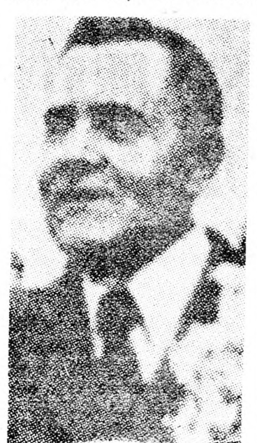
GROMIKO Meglepő megjegyzés

Gromiko beszélt arról is, hogy Izrael nem hajlandó közvetlen tárgyalásokat folytatni a PFSz-el.