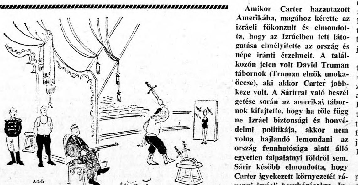
— AZ IFJU HÖLGY APJA...