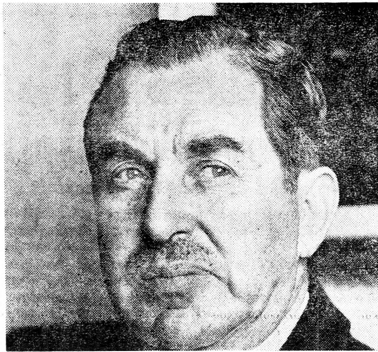
CHAJIM HERZOG: Arab üzletek Dél-Afrikával

Jellemző a BT-nek erre az ülésére, hogy az afrikai és a dél-amerikai államok delegátusai közül egyetlen egy sem kért szót. Az egyiptomi, az izráeli és a palesztinai felszólalók közül csak az Egyesült Államok és