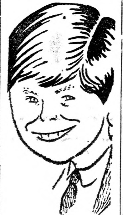
A HERCEG Lemond a trónról?

Maira Astrid hercegnőt akarja feleségülvenni. A Daily Mail jelentése szerint azonban a házasság egyetlen akadály, hogy a 23 éves hercegnő katolikus. Ha a herceg ragaszkodik Marie Astridhoz, s oltár elé vezet, kénytelen lesz lemondani trónjáról.