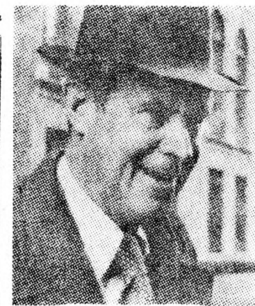
CYRUS VANCE: „Csalódtam...”

Moszkva (UPI, IFF, Reuter). — Cyrus Vance amerikai külügyminiszter tegnap este nyilvánosságra hozta, hogy a Szovjetunió elutasította Amerika javaslatait