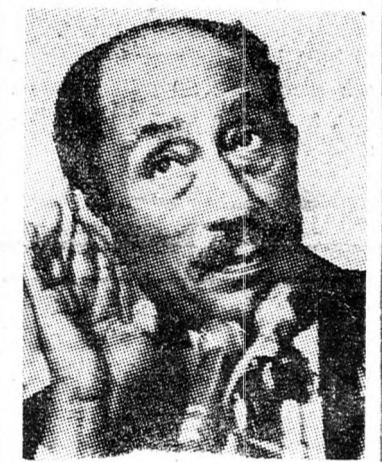
SZÁDÁT Globális elrendezés

Anuár Szádát egyiptomi elnök ma érkezik Bonnba, ahol Walter Scheel államelnökkel, Helmut