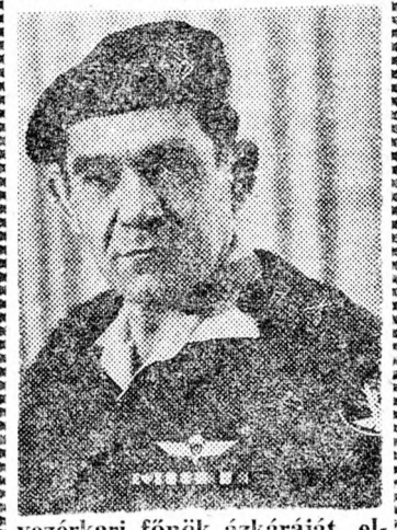
vezérkari főnök azkárját, elhalálozása első évfordulója alkalmából.

Tegnap délután a Jeruzsálemi Herzi-hegy katonai temetőjében tartották Dávid („Dado”) Elázár tábornok, a 9.