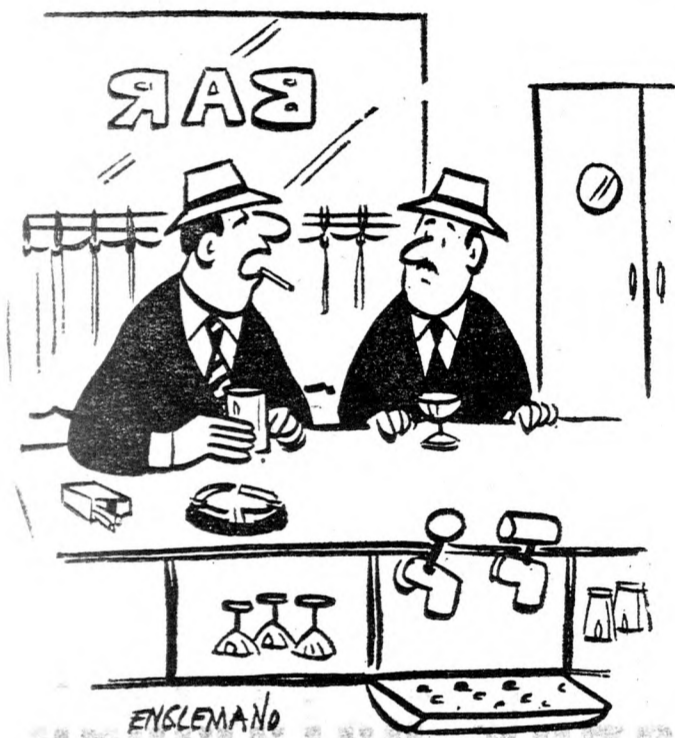
En is elhagytam egyszer a cigarettázást. Ez volt életem legszörnyűb másfél órája!

„Helyzetünk ténylegesen nehéz, de nem akarjuk kimutatni, hogy félünk.”