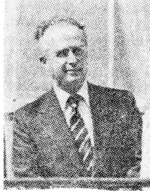
RABIN Feléd a náciizmus

vönket” — mondotta Rábin. Tegnap este Tel Avivban, Hai fán, Tel Jicchákban, valamint az ország más helyein is tartottak kegyeleti emlékgyűléseket a vézkorszak mártírjai emlékére.