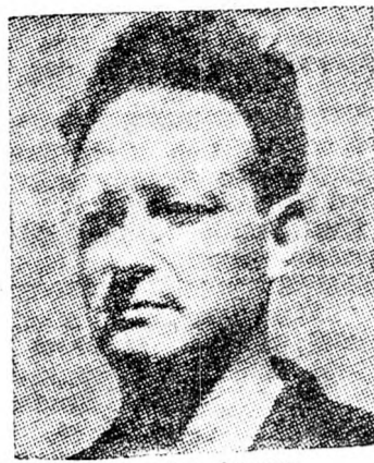
JIGAL ALON Figyelmeztetés négy pontban

A külföldi tényezőkkel való érintkezés során felhívták a figyelmet arra, hogy a terroristák szervezeteinek Dél-Libanban való előretérése a szíriaiak segítségével történik, akik véget tudnának vetni a vérengzésnek, ha ez szándékukban állna. Különösen gyakori volt az érintkezés az Egyesült Államok vezető köreivel, hogy ismertessék velük a legutóbbi fejlemények izraeli értékelését, azzal a kéréssel, hogy Washington mind ezt továbbítsa a szíriai kor-