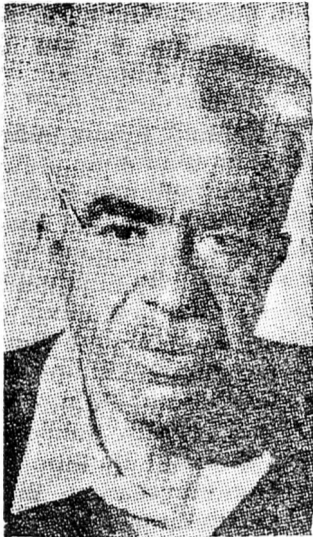
vasással kapcsolatos nehézségekkel, s így kora és egészségi állapotja ellenére, tele van életbölcsességgel. Valóságos tárháza a

Méir Jáári, az izraeli munkásmozgalom egyik veterán harcosa, 80. születésnapját ünnepli. Van valami szimbolikus abban, hogy Jáári, aki a Mápám főideológusa és koronázatlan vezére, következetesen törekszik az izraeli munkásmozgalom és szocialista pártok összefogására napjainkban is, amikor az országot alapjában rázta meg a Rábin-ügy. Hajlott kora, testi korlátozottsága, rendkívül rossz látása és görnyedt háta ellenére, Jáári, a Kibuc Arci megalkotója és szellemi vezére, rendkívüli éberséggel, vitalitással, egyéni beavatkozással és gyors gondolkodásdjával, továbbá még hibátlan analízis képességével követi napjaink pergő eseményeit.