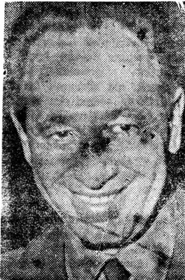
PERESZ: Férfiasan kell elviselni

Begin köszönetét fejezte ki mindazoknak, akik segítségére voltak és hittek benne. Hosszú közéleti útját feleségének, gyermekeinek és barátainak köszöni, majd kijelentette, hogy szerda reggel 10 óra összehívta a Likud vezetőségi ülését és azon javaslatot tesz a cionista pártoknak nemzeti egységkormány létrehozására. Két hét múlva, amikor a választási törvény rendelkezése értelmében az államelnök a legnagyobb pártot, tehát a Likudot bízza majd meg kormányalakítással, s az új kormány elfoglalja hivatalát, azt javasolom majd Szádnak, Ászádnak és Husszeinek, hogy üljünk le tárgyalni a mi fővárosunkban, vagy az övéikben, vagy semleges vá-