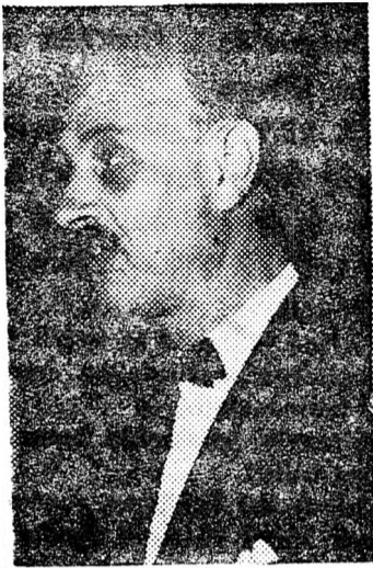
JÁDIN: Nem engedünk a 7 feltételből

ről, ez a megfontolt, ez a tapasztalt. Nem vetek semmit a szavazó szemére. Tovább fogok