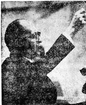
BEGIN: Megalvult álom

Simon Peresz éjjel 1.35 órakor tette első nyilatkozatát: — Nem kétséges, hogy súlyos csapást szenvedtünk el. Nincs értelme eltussolni, vagy eltitkolni ezt a tényt. Mindamelllett a Munkapárt nagy és az ország életében gyökeret eresztett mozgalom és nincs semmi kétségem afelől, hogy fiatal erők