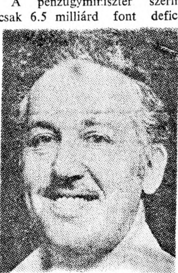
GÁD JÁKOB: Pótköltségvetés elkerülhetetlen

fokozza majd az inflációt, ami lehetetlenné teszi a nemzetgazdaság további fejlődését. A pénzügyminiszter szerint csak 6.5 milliárd font deficit