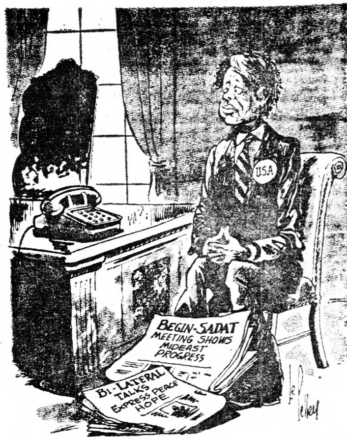
Begin — Szádát: — Várjon a telefonnál, amíg felhívjuk...

Szádát nyilvánvalóan új remények útját nyitotta meg a zsidó-arab konfliktusban. A palesztinoknak inkább arra kéne törekedniük, hogy hasznot huzzanak ebből a helyzetből, mintsem, hogy szüntelenül hangoztatták felháborodásukat.