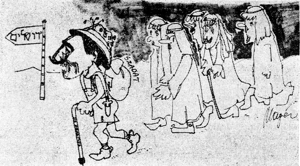
SZÁDÁT: — UGYE MEGMONDTAM, HOGY BEVONULUNK JERUZSÁLEMBE ... (Slomó Mágén karikatúrája)

Beszámolóinkhoz hozzá kell még fűzünk azt, amit Hárél maga is többször hangsúlyoz: az emberi beszéd bevizsgálása ez az igazmondó géppel egyelőre még kísérleti stádiumában van és nem szabad neki tudományos megbízhatóságot, vagy megalapozottságot tulajdonítani.