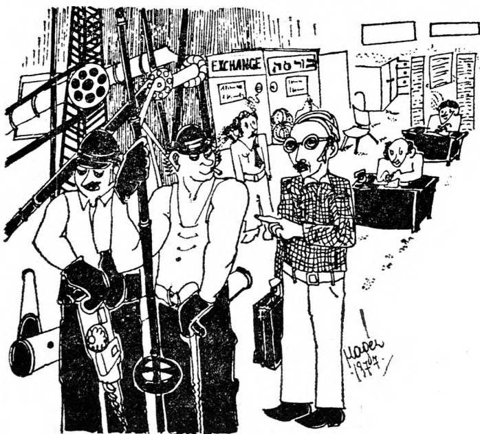
FEKETE VASÁRNAP A TOZSDÉN

Chevrot Hábituách B'Jisráél Igud L'Bituách Nifgáj-Rechev B.M.