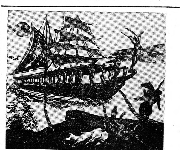
RABELAIS: GARGANTUA ÉS PANTAGRUEL

A lord úgy véli, hogy javaslata praktikus és a gyakorlatban megvalósítható. „A tervezet célja az, hogy Jeruzsálem egységének megőrzése mellett legyen egy arab és egy izraeli városrészt. Ennek a tervezetnek nagy előnye az — folytatja Caradon lord — hogy a jelek szerint az egyetlen olyan megoldásnak látszik, amely magában hordja a közkeletű béke megteremtésének reményét”.