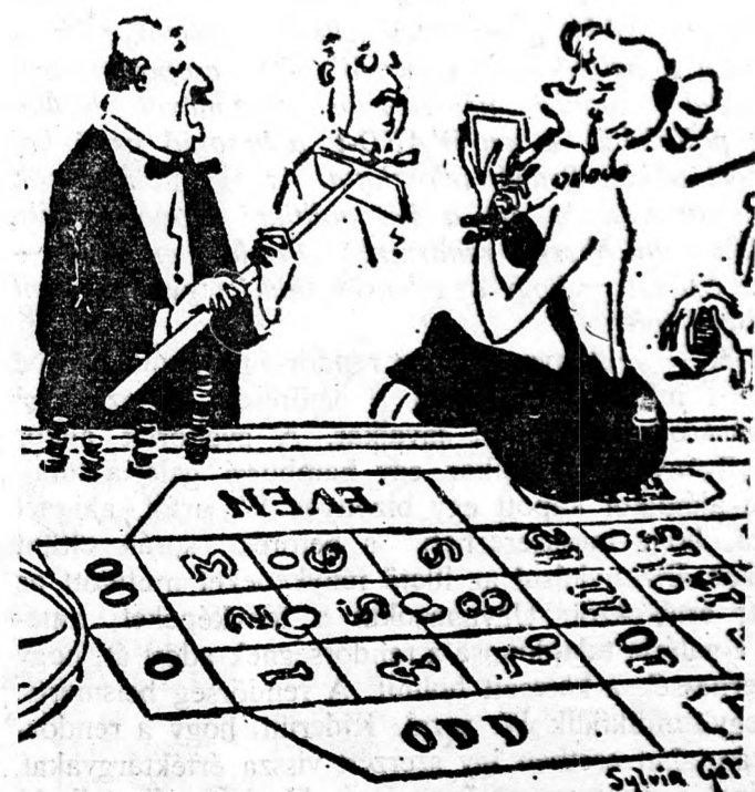
— EZ AZ ÖN TETTE, ASSZONYOM?