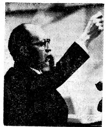
Begin miniszterelnök a repülőtéren, ahol fogadtatást tartott.

A főváros bejáratánál is örömmel fogadták a miniszterelnököt, akinek Teddy Kollek pol-