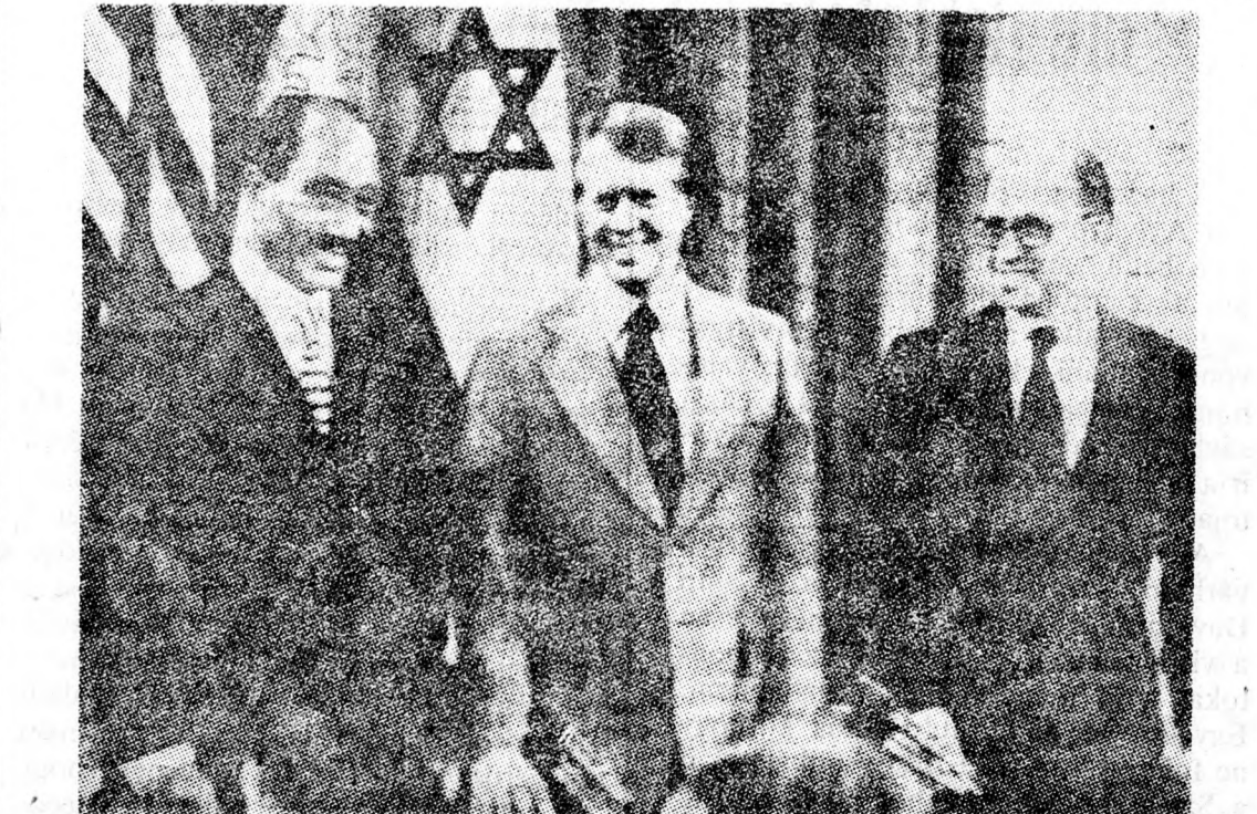
Anuár Szádát, Jimmy Carter és Menáchem Begin mosolyogva fogadják az ünnepelt a Fehér Ház keleti termében

Kijutott az ünnepségből Menáchem Beginhez is, aki beszámolója úgy kezdte, mintha