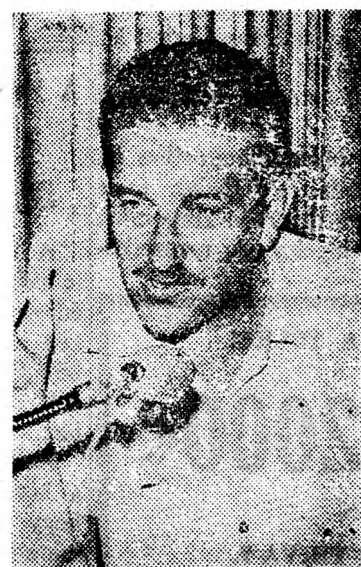
EZER WEIZMAN: Félmilliárdos pótszegély

A Holttengeri Kálisóművek az állam legjobban kereső és leg többet exportáló vállalata. Az ez év március 31-én végződő költségvetési évben a kivétel 49 millió dollárt tett ki az előző évi 32 millió dollárral szemben, azaz a növekedés 32 százalékos volt. A kálisó-termelés 1977—78-ban elérte az egymillió 940 ezer tonnát, ami azt jelenti, hogy az üzem teljesítőképességét kimerítette a jelenlegi felszelelések mellett. Ez a mennyiség 18 százalékkal több, mint az előző évben volt. A külföldi és belföldi eladás egymillió 250 ezer tonna, ami 45 százalékos emelkedést jelent az előző évvel szemben. A eladások összértéke több mint egymillió font és a haszon az adó levonása előtt 428 millió font volt. A vállalat 30 százalékos osztalékot fizet közpénzben, azon kívül 25 százalékos részvényekben.