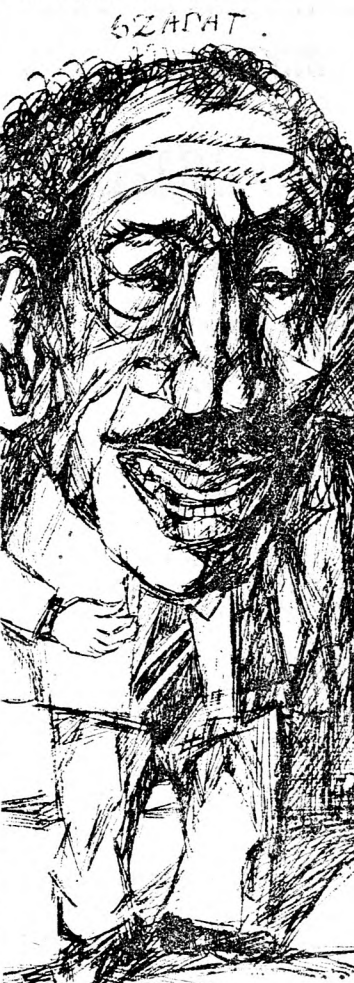
SZÁDÁT: Nyitva hagyta a béke felé vezető ajtót (Slomó Mágén karikatúrája)

csúcsertekezlet nem kevésbé fontos esemény, mint Szádát jeruzsálemi látogatása volt. "Lehetséges, hogy a tárgyalások csak Camp Davidben kezdődnek el komolyan és ezért szükséges a King David at-