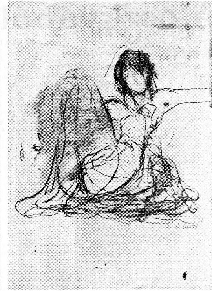
WEISS ÁRJE (TIBOR): SZÉNRAJZ

A nyelvi kérdés, a gyerekek iskoláztatása, a quebeci zsidóság problémáinak, bajainak csak egy részét képezi. Több-ről: a Quebecben élő zsidó népcsoport jövőjéről van szó. Szíve mélyen a zsidóság a konföderáció és nem a konfrontáció híve. Még sem mer egységes frontot alkotni a Parti Quebecois-val szemben. Attól tart, hogy Ottawa és Montreal keresztijében a zsidóság elvérezhet. Veszteség már így is jelentékeny. A fiatalok tömegesen elhagyják a tartományt, jóléti intézményeik súlyos anyagi gondokkal küzdenek. Így született meg egy felemás javaslat, mely passzivitásra itéli a Kanadai Zsidó Kongresszust. Az angol-francia vetélkedésben a zsidóság álláspontján nem határozott, mert nehéz időre látni az eljövő esztendő politikai légkörét. A Trudeau és Lévesque közti viszály-