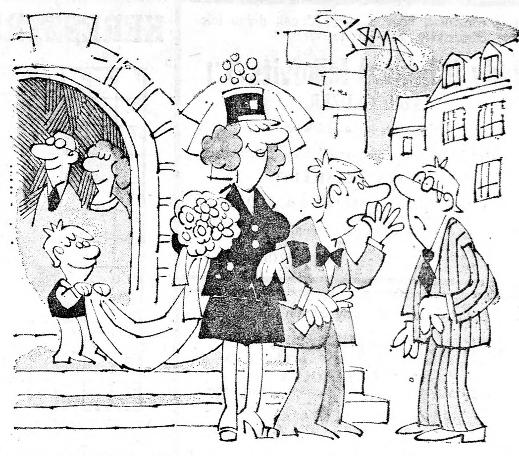
— Választanom kellett: Vagy elveszem, vagy elveszik a hajtási engedélyemet...

KADAR BÉLA, HERMAN LIPÓT, NEOGRÁDI ÉS MÁS MÁRKÁS FESTMÉNYEK KLEIN ANDRÁS TEL-AVIV, ROTHSCILD 89 TELEFON: 623-759