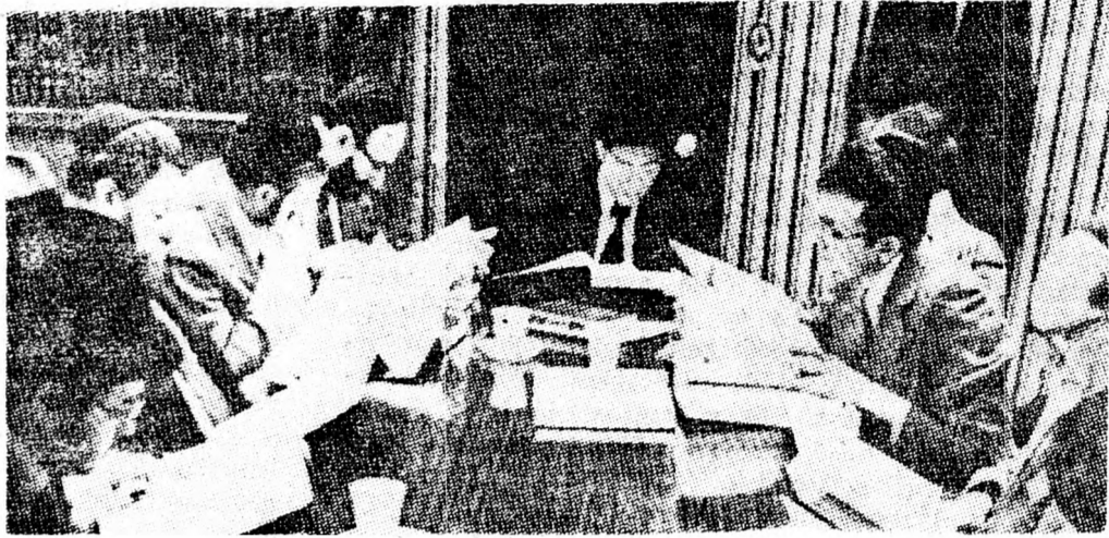
TALMUD-ÓRA A WALL STREETEN

volt hajlandó engedni. Tehát, mivel neki az első vevő volt szimpatikusabb, a másikhoz nem volt őszinte, azzal nem is akart üzletet csinálni, tehát az ajánlat tulajdonképpen érvénytelen. Heves vita alakult ki. Többben azzal érveltek, hogy mivel a kereskedő nem volt őszinte, megkülönböztette vevő-