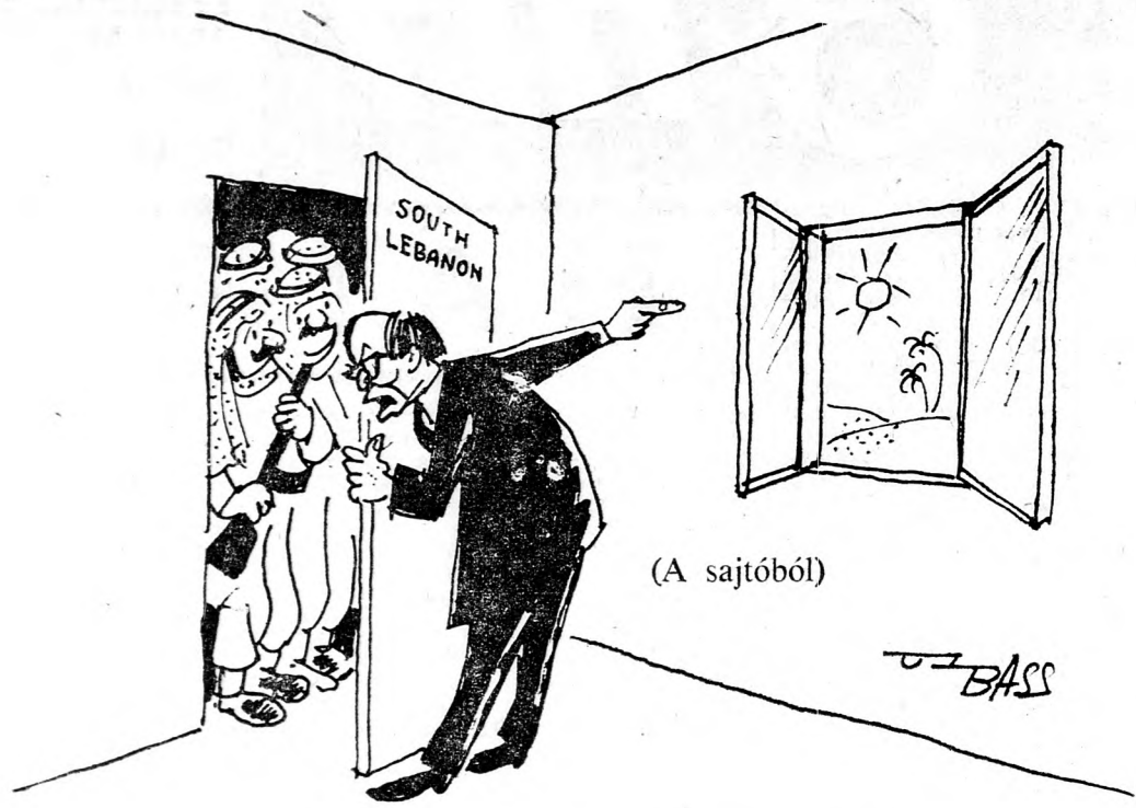
Begin miniszterelnök: Bejárt az ablakon át

Izraelben hajlamosak belemenni abba, hogy a libanoni zászlóalj délre vonuljon, de nem a keresztények beszögellésén keresztül.