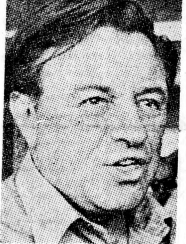
KOLLEK: „Kénytelen voltam...”