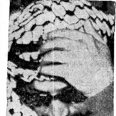
ARAFAT „Rossz fényben”

A palesztinai terrorlegények a múlt héten körülfelkértek és foglyul ejtettek 40-50 UNO-katonát, akik a dél-libanoni Cor övezetében állomásoznak. Most tudódott csak ki, hogy a PFSz terroristái nem elégedtek meg azzal, hogy „foglyul ejtették” az UNO csapataiban szolgálókat, de súlyosan megverték őket, sőt, hogy megalázzák az UNO katonákat, meztelenre vetkőztették őket, elrabolták pénzüket és óráikat, valamint személyi felszerelésüket és jegyvereiket, mielőtt csífonddáros módon útjukra bocsátották volna őket.