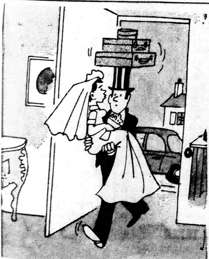
— Mi bajod lett volna, ha még egy utat csinálsz?

PARIZS: — Franciaországban 15 millió elhízott embert tartanak számon, akik egészségüket veszélyeztetően túlkövérek. A számtalan fogyasztási recepteket tartalmazó könyvek mellett, amelyek hosszútávon nem mutatkoztak hatásosoknak, egy bizonyos Raoul Mille nevé, maga is tulsúlyban lévő férfi „A „kövérek” címmel írt könyvet, Mille azt állítja, hogy a szüntelen büntudat, amely a torkos kövér embereket kinozza, több kárt okoz az egészségüknek, mint a mértéktelen evés. Írásának célja: megszabadítani komplexumaitól a diétára fogott mártírokat.