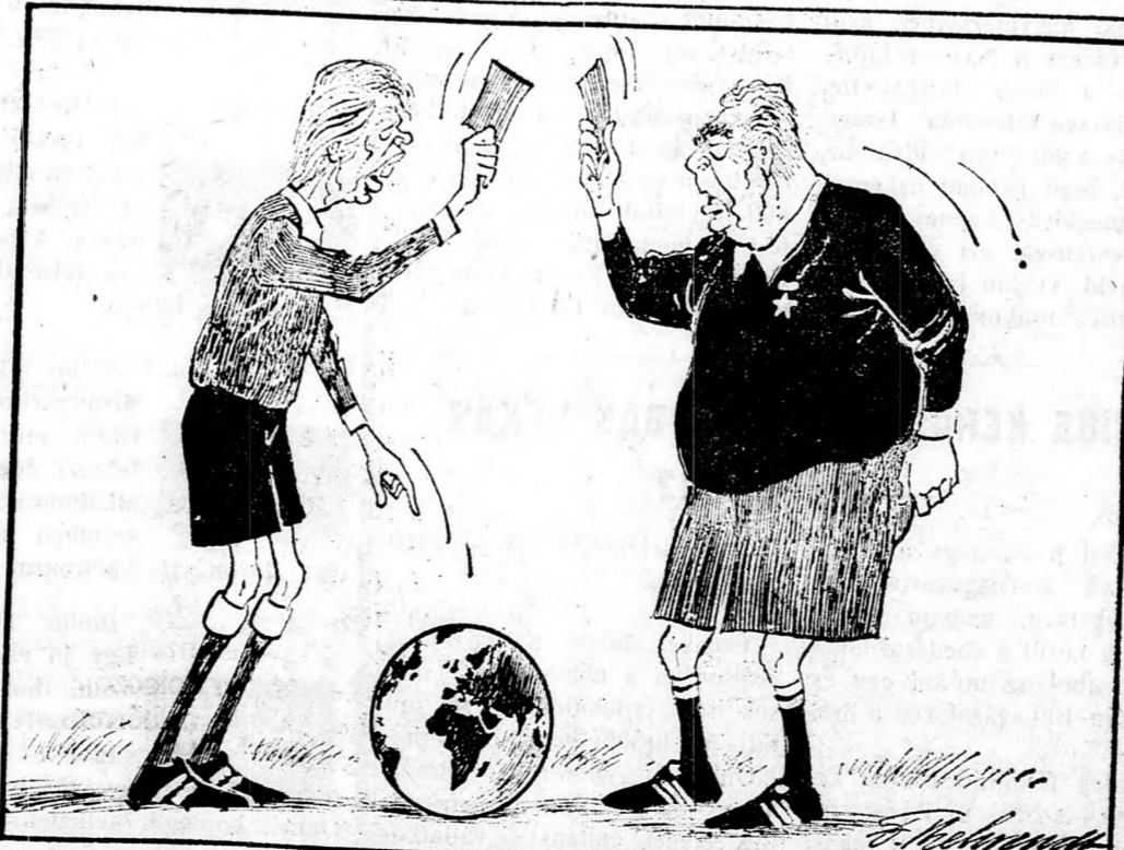
Sárga lapot a szabálytalankodóknak...