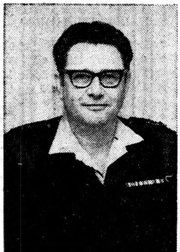
Slomo Gázit tábornok a vezérkar hírszerző osztályának főnöke

nem válik ki az aktív szolgálatból és 1979 végéig megmarad jelenlegi feladatkörében.