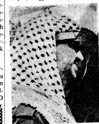
Cháláf véleménye szerint Izrael igyekszik majd összecsapást provokálni Libanonban, a terroristák és az UNO-katonák között. Ezzel kapcsolatosan beismerte, hogy a terroristák több ízben megszegtek az egyezményt és ezért „szükség van a felelőlen elemek megfékezésére.” Aráfat helyettese utalt arra, hogy a terroristáknak szándékukban áll a végleges izraeli visszavonulás után az eddignél nagyobb erővel visszatérni Libanonba.

hadserget feladata végrehajtásában. Ugyanakkor lehetségesnek tartják, hogy libanoni tengeri