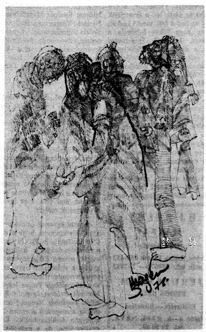
SLOMO MÁGÉN: TANULMÁNY

CANNES: — A cannesi filmfesztivál keddi szenzációja az amerikai Paul Mazurski filmje volt: „Egy szabad asszony”. A film a new-yorki erkölcsökről fest megkapó képet, s egyesíti az amerikai filmszínészek tehetségét az Ingman Bergman-nál megszokott finom lélekelemzéssel. Egy magáramaradt középkorú nő életét ismertette, betekintést nyújt egy bizonyos rófé életébe, ahol az altatók, a gépies szerelmi élet, a házi pszichológus, a nőklubbok megannyi menekülési eszközt jelentenek az egyre súlyosabb elidegenedés ellen. Noha a film mondani valója szomorú, hangvétele mindvégig vidám, érzelmes, mélyen emberi.