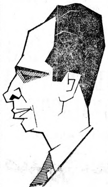
PERESZ „Téves politika”

Flatto közben folytatta és többek között kijelentette: „A PFSz képviselői itt, a Kneszet ülésében foglalnak helyet!” Elíav: „Ez a gengszter, tolvaj, merészel ilyesmit állítani!” Végül, amikor a kedélyek nagy nehezen kissé lecsillapodtak, a Kneszet a koalíció nagy szótöbbséggel elvetette az ellenzéki frakciók által támogatott bizalmatlansági indítványt. Csak a Független Liberális Párt egyetlen képviselője tartózkodott a szótól.