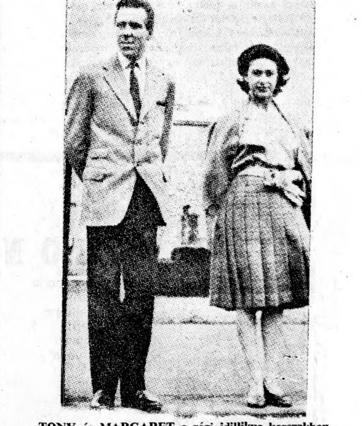
TONY és MARGARET a régi idillikus korszakban

London (UPI). — Margaret a dettel, rövidesen visszatér eroga hercegő, II. Erzsébet királynő húgának 18 évig tartó viharos, válságokkal teli házasságát felbontotta, a 33 éves Tony Armstrong-Jones egykori divatfényképezéssel, akit az esküvő után lorddá ütöttek, tegnap az angol főváros bírósági ülésében hivatalosan is végleg elvált. A választ a férj lord Snowdon kérésére mondták ki, Margaret hercegő (48) nem