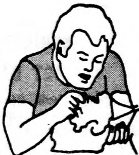
B. A LÉLEGZÉS

Ha a beteg nem lélegzik, fogja be az orrlukait. Vegyen mély lélegzetet, illesse ajkát a betegére, s addig lehellen bele, míg nem látja emelkedni a mellkasát. Vegye el az ajkát, hogy a sérült lélegezhessen. Ismétlje gyorsan négyeszer egymástán ezt a műveletet, aztán vizsgálja meg a sérült nyaki ütőerét. Ha már megint ver, folytassa percenként tizenkétszer a belélegzést. Gyerekek és csecsemők mesterséges lélegzésénél takarja le a szájjával a gyermek orrát és száját, s gyengéden lélegeztesse percenként hússzor.