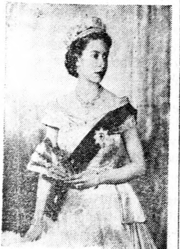
II. ERZSÉBET „A kapcsolat — tökéletes”

Bonn (UPI). — Tegnap lelkes tömeg fogadta „Lisbeth! Lisbeth!” kiáltásokkal II. Erzsébet angol királynőt, aki hivatalosa látogatója.