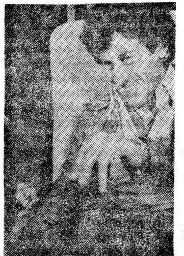
Eddig a népszerű sorozat 67 filmjében vettem részt és elő-

viddal s akárcsak egy házaspárnál, köztünk is előfordulnak nézeteltérések.