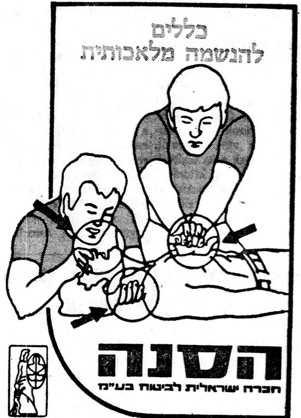
A. LEVÉGO SZABAD ÁRAMLÁSA

esetben pusztult el. Terjeszt ezeken kívül a „Szné” tízezres példányszámokban munkabalesetek megelőzésével foglalkozó füzetet is a gyárak, üzemek használatára, benne a cég munkabiztonsági mérnökök tanácsaival, javaslataival. A „Szné” jelentős kedvezményeket is biztosít azon ügyfelei számára, akik a cég által javasolt biztonsági berendezéseket, záradakat, széfeket stb. akarják beszerezni.