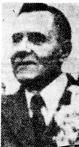
ANDREJ GROMIKO „Közös érdek”

A szovjet külügyminiszter egyébként pénteken készült beszédet tartani az UNO közgyűlésén.