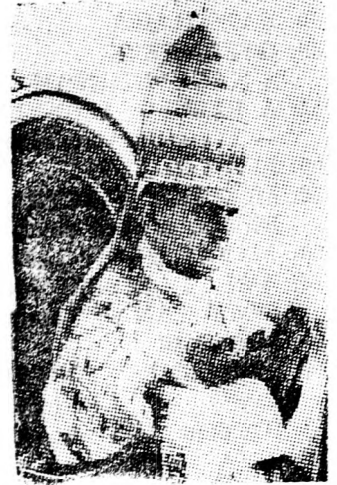
VI. PÁL PÁPA „Bocsásunk meg!”

Róma. (UPI, Reuter, IFP). — Aldo Moro családja azonban bojkottálta a gyászmisét. Több mint 100 ezer ember vett részt tegnap az Aldo Moro lelkiüdvéért megrendezett gyászmisén, amelyet a Vatikánvárosban tartottak. A gyász-szertartást maga VI. Pál pápa vezette le, aki különleges imaszöveget készített meggyilkolt barátja, a volt olasz miniszterelnök, a kereszténydemokrata párt vezetője emlékére. Az