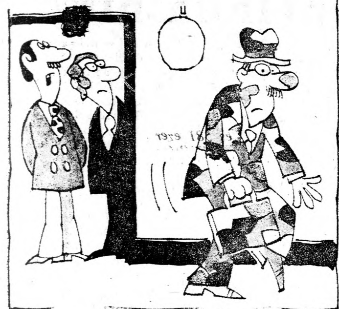
Nem akar feltűnést kelteni a vállalatnál...