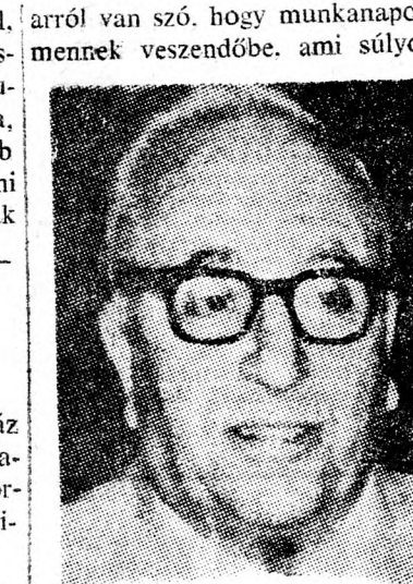
JERUCHÁM MESEL „Hátrányos helyzet”

Rendőrségi vizsgálat során elmondotta a turistanó, hogy 400 font volt a retikúljában. Folyik a nyomozás a tettesek kézrekerítésére.