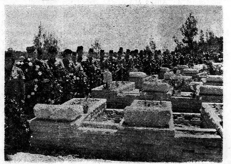
JERUZSÁLEM: HERZL-HEGYI KATONAI TEMETŐ

A rendőrség szóvivője az esti órákban közölte a sajtó képviselőivel, hogy 4 rendezavót letartóztattak és bűnvádi eljárást indítottak ellenük. Hozzátette, hogy a rendőrség vizsgálót indított az ellentüntetők politikai hovatartozásának megállapítására.