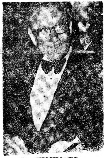
Dr. KISSINGER „Baráti államok”

A volt külügyminiszter sajnálta, hogy az egykori külügyminiszter Izraelnek szánt repülőgépek eladását csomagügylet keretében ik-