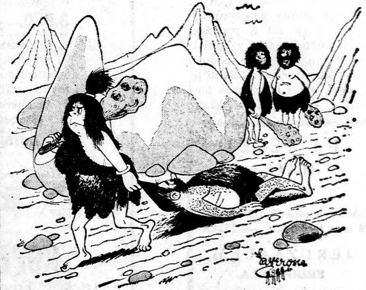
— A tárgyalások úgy látszik nem vezettek eredményre... 1978. V. 8. 3.

BERN. — Egy közvéleménykutatás eredményei szerint a svájciak 75 százaléka a munkakonfliktusok békés, vagyis sztrájk nélküli megoldását tekinti helyesnek. A múlt esztendőben végzett felmérés eredménye megközelítőleg ugyanez volt.