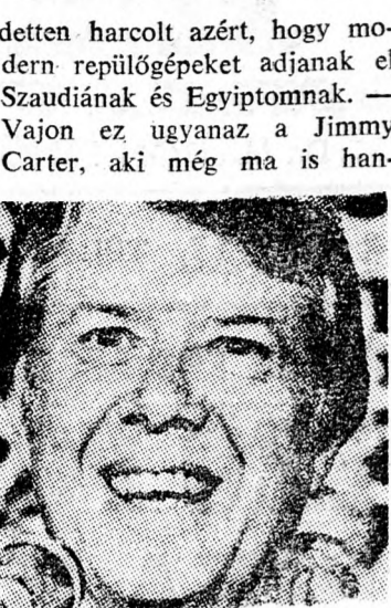
Jimmy Carter, aki még ma is handten harcolt azért, hogy modern repülőgépeket adjanak el Szaudiának és Egyiptomnak...