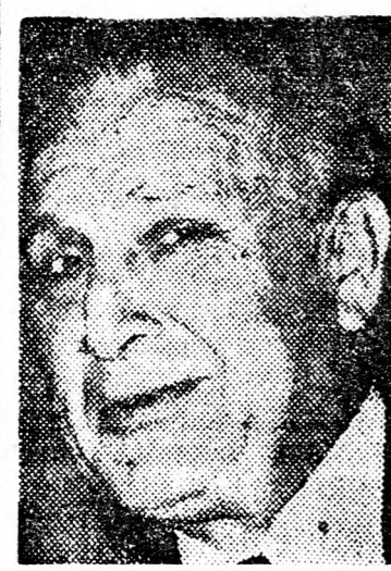
Efrájim Kácir professzor, aki május végén fejezi be államelnö-

Jeruzsálemben is lesz szolgálati lakása, amelyet volt államelnökként bocsájtanak a rendelkezésére — Május 29-én lép hivatalába Jicchák Návon