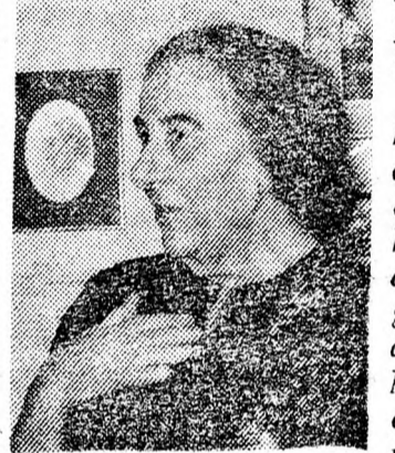
Izraeli nagyszónya, Golda Meir volt miniszterelnök, ma ünnepli 80. születésnapját...