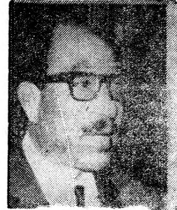
ANUAR SZADÁT: Megnyertük a közvéleményt

„Vádatlanul kitaláltak azon elvek mellett, amelyeket meghirdettünk a Kneszetben, az izráeliek saját házában. Ezek az elvek — teljes izráeli visszavonulás, és önrendelkezési jog a palesztinaiaknak. Soha nem mondunk le ezekről az elvekről.” — hangoztatta.