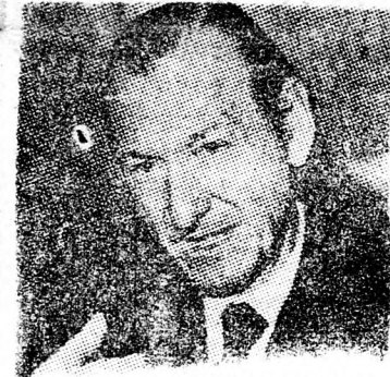
Dr. KURT WALDHEIM: 6000 szükséges