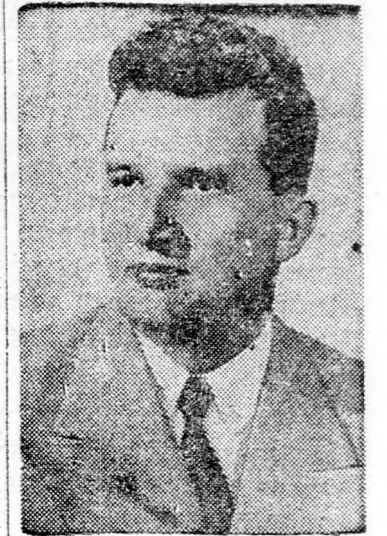
ROMÁNIA ELNÖKE: Aráfat nem jött