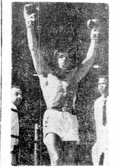
LETETTE A KESZTYŰT...

Nairobi. (UPI). — Muhammed Ali (Cassius Clay), a volt nehézsúlyú ökölvívó profi világbajnok, egy amerikai rabszolgát