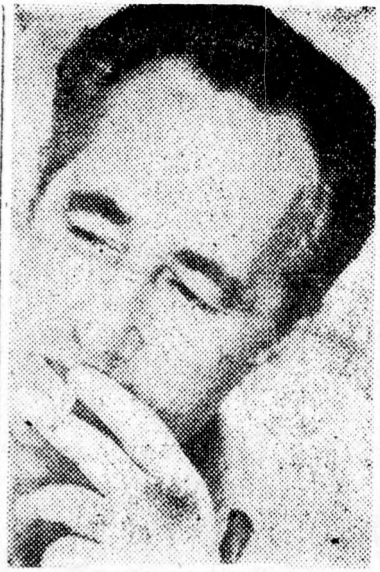
SIMON PERESZ „Reagálni kellett!”

Kifejtette még az előadó, hogy a Máágán Michaelnál csö-