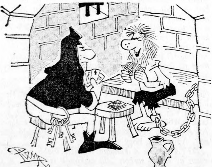
— En felteszem erre a lapra a korszomat és a láncot, a maga kulcsomjára ellenében.

A holland parlament egyes tagjai most vizsgálatot követelnek a „Fekete Könyv” állításai tárgyában, mert szerintük a holland kormány nagymértékben felelős az arab bojkott Izráelnek súlyosan ártó következményeiért és minden tételes emberi törvény értelmében kötelesek küzdeni e bűnös megkülönböztetés ellen, mely ma már a zsidó alkalmazottak ellen is irányul.