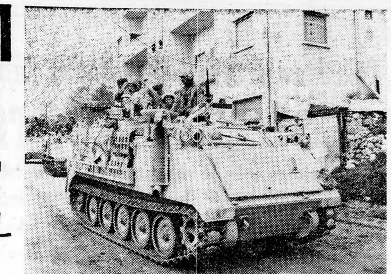
IZRÁELI HARCOKOSI ELŐNYOMULÁS KÖZBEN