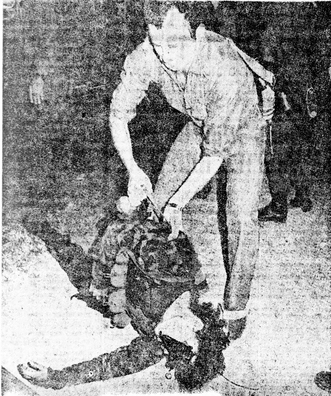
Az egyik leterített terrorista.

nyos" jellegre helyezi a hangsúlyt. „Harminc halott és hatvan sebesült a legjelentősebb gerilla támadás eredményeként”. Ez a címe az „Al Náhár” című független lap cikkének. A francia nyelven megjelenő „Le Reveil” konzervatív újság vastag-