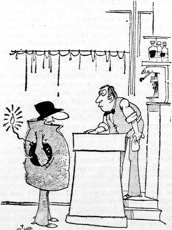
— Kérek egy feketét. De gyorsan! Sürgős dolgom van...