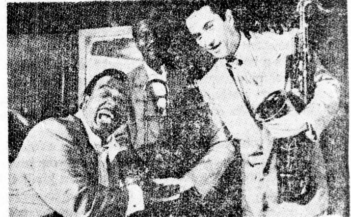
„NEW-YORK — NEW-YORK”, jelenet a filmből

A „New York — New York” modern film, amelyet a régi vigjátékok modorában forgattak. Viszontlátjuk azt a boldog időszakot, amely 1945-től a győzelem eufóriája után, a koreai háború és a mcarthyizmus sötét korszakáig tartott.