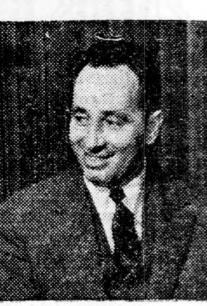
Simon Peresz Kneszet-képviselő, az ellenzék vezére, aki jelenleg Nyugat-Németországban tartózkodik.

TEL-AVIV, RECHOV HARAKEVET 52, P. O. B. 831 • TELEFON: 30011 A szerkesztőség nem felel a hirdetések tartalmáért. Kéziratokat nem őrzünk meg és nem küldünk vissza. Az olvasóleveleket kérjük lehetőleg írógéppel, de legalább olvashatóan érni és pontos címmel ellátni. Névtelen, vagy személyeskedő, sértőhangú leveleket nem közlünk.