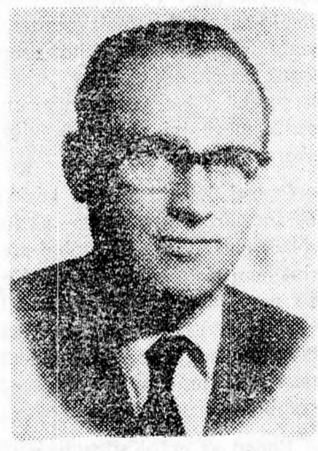
„Kritikusaival szemben mindig igaza volt...”