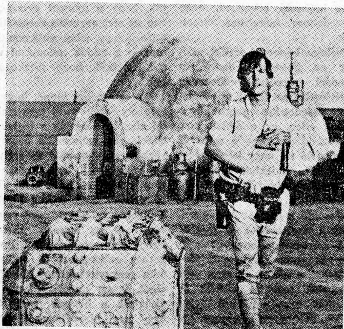
Jelenet „A csillagok háborúja” című filmből.

Lewy” gyártmányú izraeli konzervek háttérben, az izraeli hősi-hatóságok és a hadifoglyokat ábrázoló visszatérő képek árnyékában. A kiállításon látható, hogy Szádát békeoffenzívája előtt terelték meg. Az egyik falon látjuk Aráfat képét, amint Szádát oldalán katonai díszszemlét tart és közben átkarolja az egyiptomi elnököt. Az idegenvezető rá-mutat: „Ez az ember a szülő-földjét akarja visszazerezni és maguk megtagadják tőle. Miért csak önöknek jár szülőföld és a palesztinaiaknak nem. Önök vették a földjeinket”. Amikor csendesen megjegyezzük, hogy Izrael államának megalapítása (Folytatás az 5-ik oldalon)