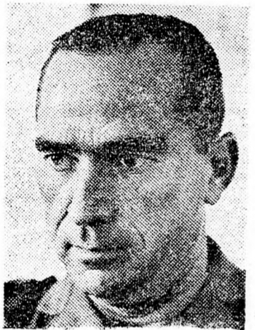
Ráfáel Ejtán, a vezérkari főnök jelöltje.

Ráfáel Ejtán („Ráful”) tábornok a legesélyesebb jelölt. Az új vezérkari főnök kinevezéséről tárgyal a kormány az egyik legközelebbi ülésén, talán ma. Mordecháj Gur vezérkari főnök két hónapon belül