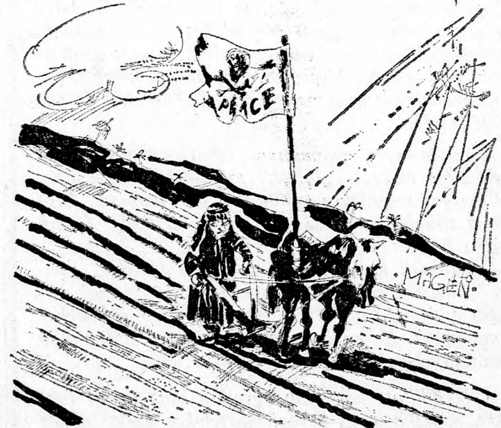
Arab kövételés: Fel kell szántani a zsidó települések helyét a Szinájban.

Az izraeli arabok gazdasági helyzete sokkal jobb, mint a többi arab országban élő testvéreiké, kivéve a Perzsa-öböl egy-két nagy petróleumtermelő minállamát. Tudni kell, hogy összadósságaik nem érik el a Társadalombiztosítótól kapott segély összegét. Az arab család átlagos évi jövedelme 24.000 izraeli font, míg a keleti származású izraeli zsidó családé csupán 20.600 font. (Ezt az adatot az izraeli Munkapárt arab részlegének a főnöke, Róánán Kohén közli.) Az arab lakosság körében nincs munkanélküliség, és széleskörű kulturális, törvénykezési és választási autonómiával rendelkeznek. Az izraeli arab boldog ember lehetne, úgy látszik azonban, hogy nem az. A jogok és kötelességek terén kihirdetett egyenlőség nem valósulhat meg teljes mértékben, elsősorban a háborús állapot miatt, de azért sem, mert Izrael állama jellegzetesen zsidó állam. Nagyon sok mindent sikerült elérni az egyenjóság terén, és még az, hogy ez a kisebbség akár békeidőben is, nem fogja kisebbségnek érezni magát.