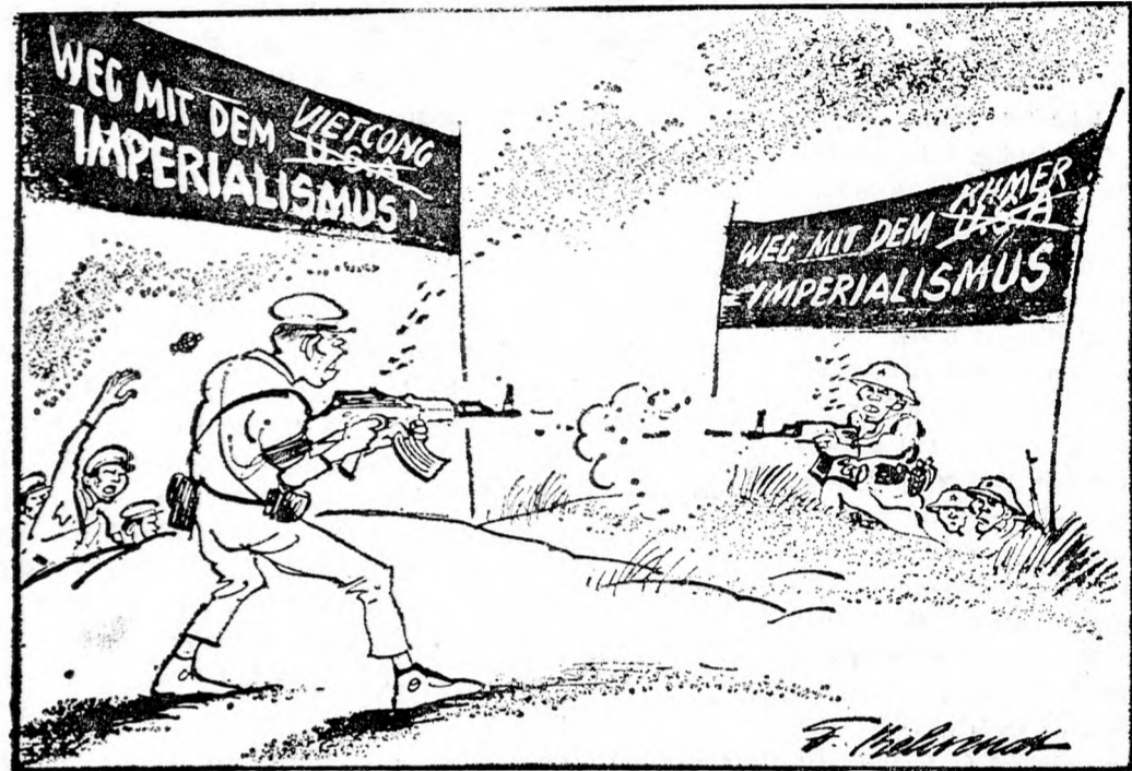
INDOKINÁBAN ÁTFESTIK A CÉGTÁBLÁKAT

Válaszul a vietnámi követelésekre, a kambodiák lakóhelyek lőttek a 25 ezer lakosú Ha Tien városát és néhány más helyiséget. Bombázásaik szabályos időközökben folytatódtak,