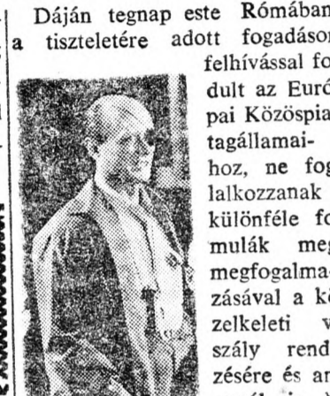
Dáján tegnap este Rómában, a tiszteletére adott fogadáson felhívással fordult az Európai Közösség tagállamaihoz, ne foglalkozzanak különféle formák megfogalmazásával a közelkeleti viszály rendezésére és ami ennél is lényegesebb, „ne avatkozzanak be egyoldalúan az arabok javára”, hanem helyett támogassák a jelenlegi békefolyamatot.

Róma (UPI, Reuter, IFP). — Mose Dáján külügyminiszter tegnap négy napos hivatalos látogatásra Olaszországba utazott, ahol csütörtökön VI. Pál pápa is kihallgatáson fogadja.