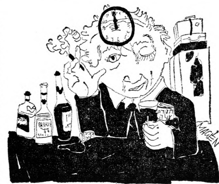
UJ OLÉ SZIVESZTERE — Valóban a csodák országa! Fél éve sem vagyok még itt és már másodszer van újév.