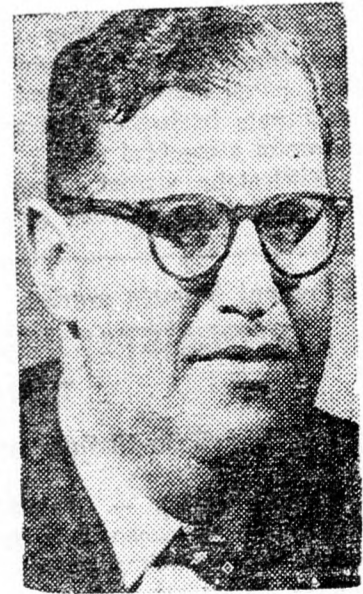
álta az egyetemeknek nyújtott támogatás összege 45 százalékkal csökkent. Ily drasztikus csökkenést az utóbbi években semmilyen más államban nem hajtottak végre és az izraeli kormány sem csökkentett más támogatást ily százalékosban — hangsúlyozta a szónok.

Aba Even volt külügyminiszter a héten a Kneszetben arra a veszélyre figyelmeztetett, hogy Izrael néhány éven belül tudományos sikon másodosztályu hatalommá degradálódhat.