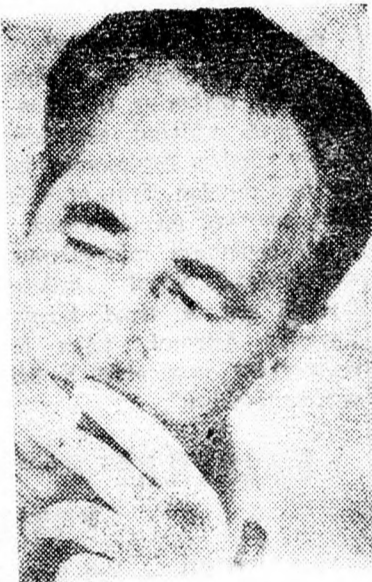
A továbbiakban hangsúlyozta Perez, hogy az Izraelben élő arab népek fontos feladata van: hidat képezhet a népek közötti kölcsönös megértés, illetve a béke felé vezető úton.