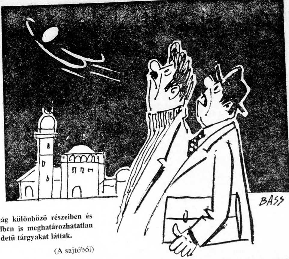
A világ különböző részeiben és Izráelben is meghatározhatatlan eredetű tárgyakat láttak.

Szükséges szakképzettség: nagy gyakorlattal rendelkezők a varrószakmában, valamint ellenőri és felügyelői munkában. Tel: 03-477251.