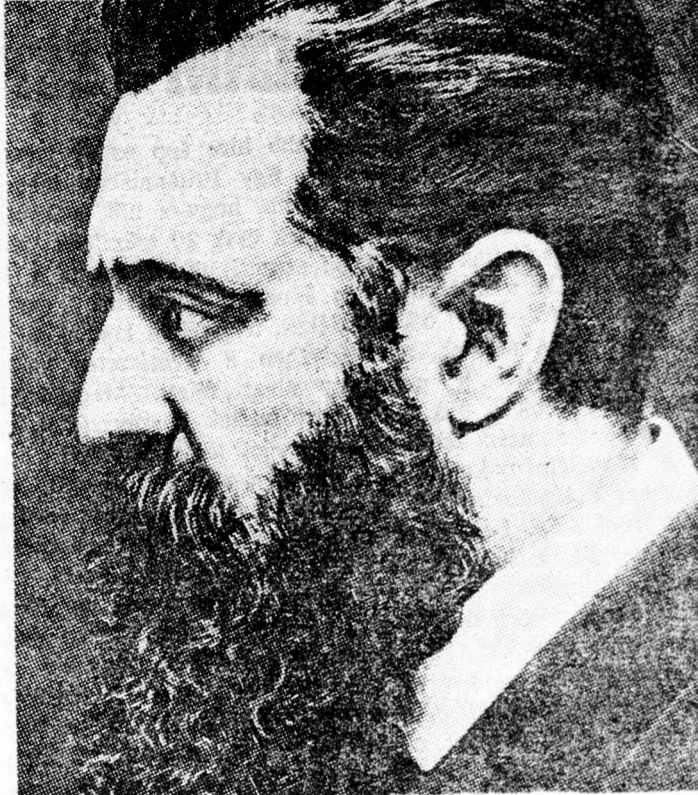
HERZL LEGUTOLSÓ FÉNYKÉPE

A falakat komoly festőművészek és grafikusok munkái festették meg. A legelső a sorban Koposor erre a ragyogó ötletre is: képe (1899), „Meinem Jugendkiállításra mindazokat az iparművészeti és részben képművészeti alkotásokat, amelyek a cionizmus megálmodójának emlékéket őrzik.