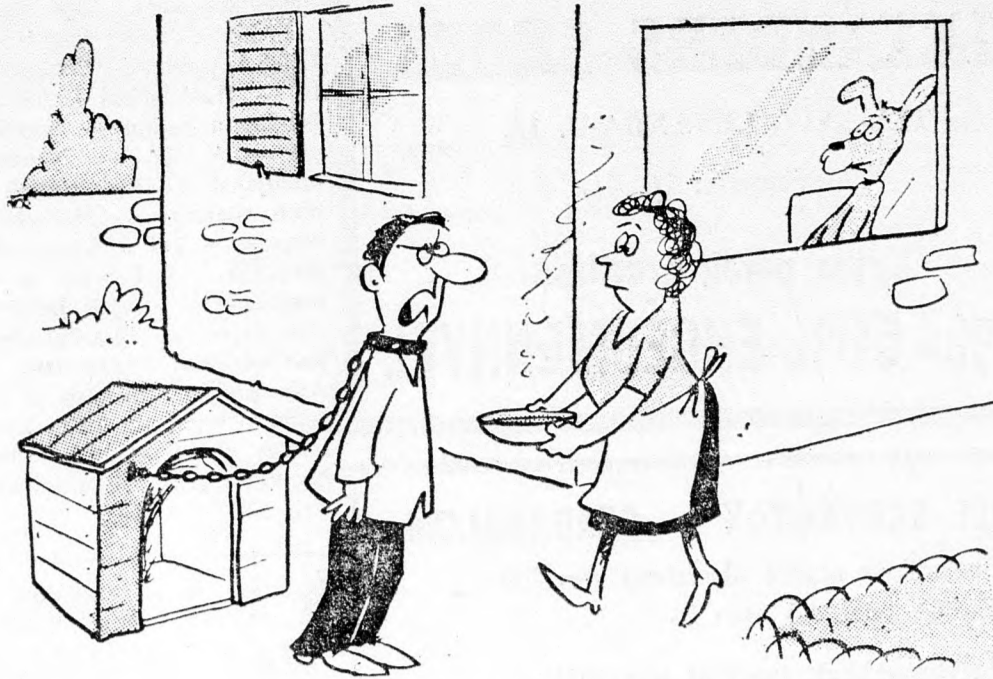
— S ezt az egész circuszt csak azért kell megcsináljam, hogy a kutya ne kapjon sokkhatást, ha majd kitesszük az ójába