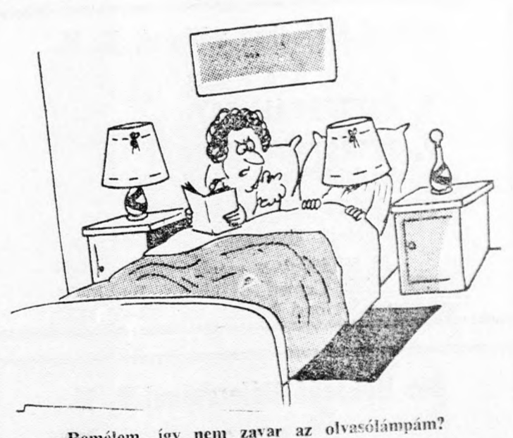
—Remélem, így nem zavar az olvasólámpám?