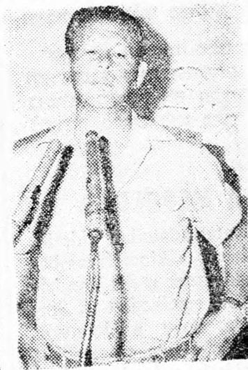
MOTA GUR miniszterelnök jelölt

Végül, egy kérdésre válaszolva, Mota Gur elismerte, hogy „a kellő időben” a miniszterelnöki bársonyszékre pályázik és alkalmassnak tartja magát erre a feladatkörre, mert komoly politikai tapasztalatra tett szert.