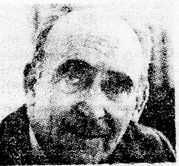
TISBI ILLES professzor

Tisbi Illés és Menáchem Álon professzorok nyertek el az idei Izrael-díjat zsidóság-tudományból — közölte a közoktatásügyi minisztérium szóvivője. Tisbi professzor életművéért, a zsidó misztika, chászidizmus és kabbala terén, míg Álon professzor, a felsőbírósg tagja, a héber törvénykutatás terén elért eredményeiért kapta a díjat.