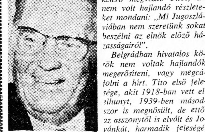
1952-ben vette el, amikor az asszony 28 éves volt, ő pedig 60.

Belgrádban hivatalos körök nem voltak hajlandók megerősíteni, vagy megafoljni a hírt. Tito első felesége, akit 1918-ban vett el, elhunyt, 1939-ben második szor is megnősült, de ettől az asszonytól is elvált és Jovánkát, harmadik feleségét