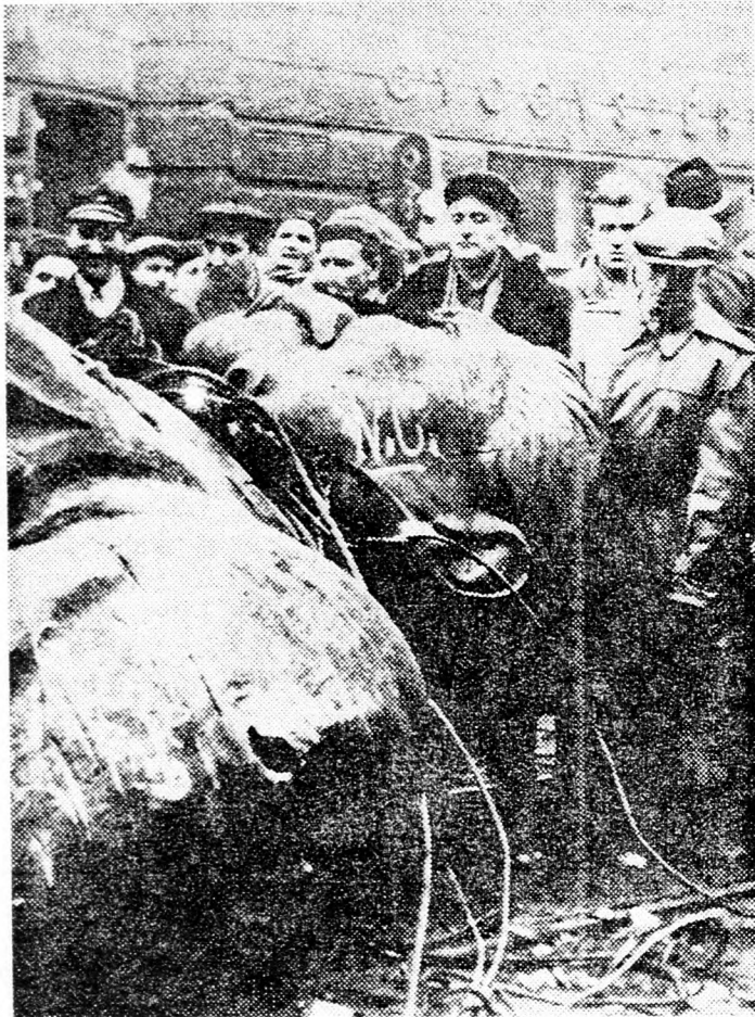
A LEDÖNTÖTT SZTÁLIN-SZOBOR (Budapest, 1956)