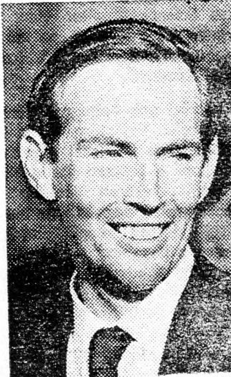
BARNARD PROFESSZOR „Inkább szex, mint futás”

„Sex-mazochizmus vagy látogatás egy masszázs-szalomban, sokkal biztosabb, mint a világon az autóból időben dívarba jött kocogás” — így véli dr. Cristian Barnard.