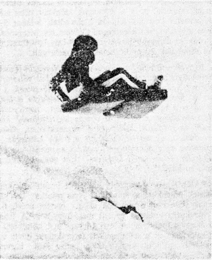
PÉNZ VAGY ÉLET

Az újságíró be is tartotta a szavát. Nem mondta el senkinek, amit Marcostól hallott. Csak közzé tette egy világlap hasábjain.