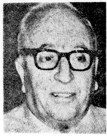
MEISEL Adáz harc...

Az üzemanyag drágulásáról tegnapelőtt különleges miniszteri bizottság határozott, amelynek tagjai Ehrlich, Patt és Modái miniszterek. Az energiaügyi minisztérium szóvivője közleményt hozott nyilvánosságra, amely megmagyarázza a drágul-